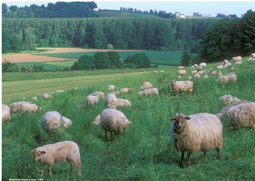
Mergellandschap in Kanne

MET DANK AAN DE NATIONALE BOOMGAARDENSTICHTING