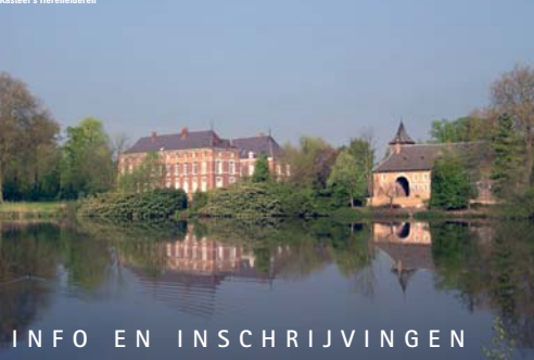
Kasteel 's Herenelderen