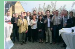
Alle partners klinken op het project

Op de Sint-Pietersberg tussen Jeker en Maas is er de voorbij jaren hard gewerkt. Daarbij is heel wat gerealiseerd voor de natuur en de recreatie. Op 25 april werd dat nog eens in de verf gezet op een succesvol symposium. Tijdens deze dag plaatsten we alle gerealiseerde projecten in de kijker en sloten alle partners