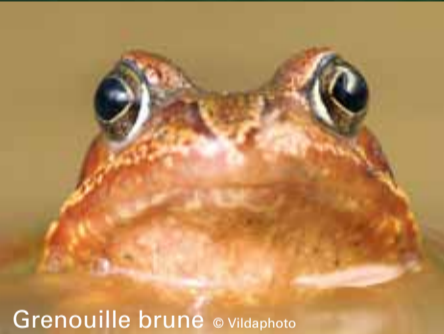
Grenouille brune

CHER LECTEUR, le printemps est de nouveau à notre porte, il est temps de partir se promener! Pendant le printemps, vous pouvez découvrir les beautés cachées de la Speelhof de Saint-Trond, la vallée du Geer, le Beukenberg et les chemins creux de Tongres. En juin, le cahier d'exercice du paysage sortira avec la boîte des promenades adaptées qui vous permettra de redécouvrir les dix points verts de Hesbaye. Regardez bien autour de vous dans votre voisinage: peut-être y trouverez-vous encore une barrière en fer forgé, une ancienne petite chapelle ou une croix fleuronée qui échappent à votre attention. Avec le nouveau projet relatif au petit patrimoine historique, nous pouvons mettre ces témoins du passé totalement sous la loupe!