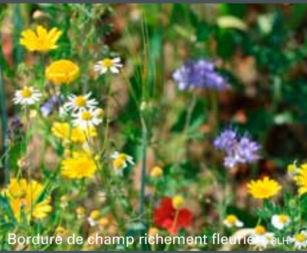
Bordure de champ richement fleurie

Landschapsdoeboek et nouvelle boîte de promenade