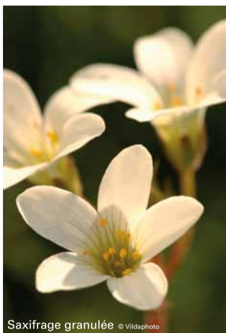
Saxifrage granulée