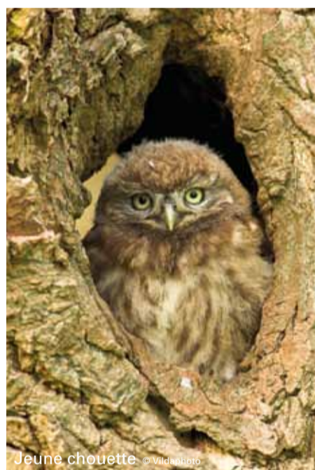
Jeune chouette

Les dépliants Beautés Cachées sont disponibles pour 1,5 € sur www.rlh.be (1 € le jour même). En achetant le dépliant, vous investissez dans l'entretien du paysage et de la nature.