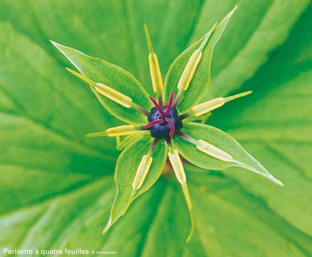
Parisette à quatre feuilles