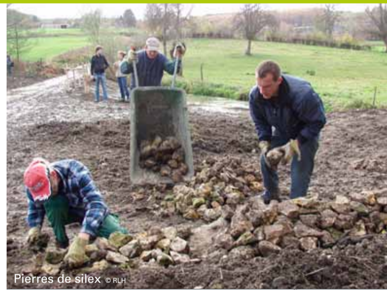
Pierres de silex

Vous verrez ainsi qu'agriculture, nature et paysage collaborent harmonieusement dans les Fourons. Profitez-en!