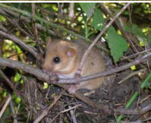
Le muscardin vit dans les haies vives.

Notre ÉQUIPE PAYSAGÈRE peut être d'une grande utilité à ce propos. Si vous cherchez de l'aide pour l'été, n'hésitez pas à prendre contact avec le Guichet paysager.