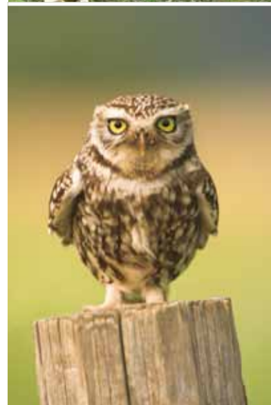
La chouette chevêche fait son nid dans le creux d'une trogne ou dans un arbre fruitier.