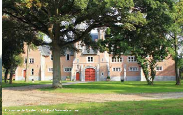
Domaine de Gasterbos