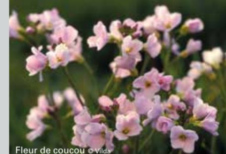
Fleur de coucou

Ce livre coûte 16,50 euros et est disponible auprès de l'Office du Tourisme de Borgloon ainsi qu'auprès de la maison d'édition Georeto, à Kortesseem. Plus d'infos sur www.geogidsen.be .