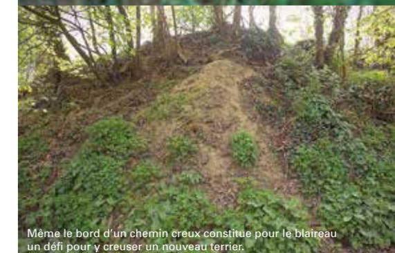
Même le bord d'un chemin creux constitue pour le blaireau un défi pour y creuser un nouveau terrier.