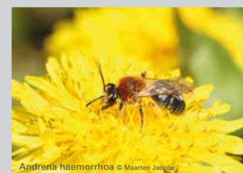
Androna haemorrhua © Maarten Jacobs