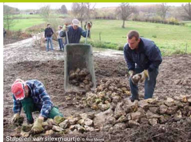
Stapelen van silexmuurtje

Zo zie je dat landbouw, natuur en landschap in Voeren harmonieus samenwerken. Geniet ervan!