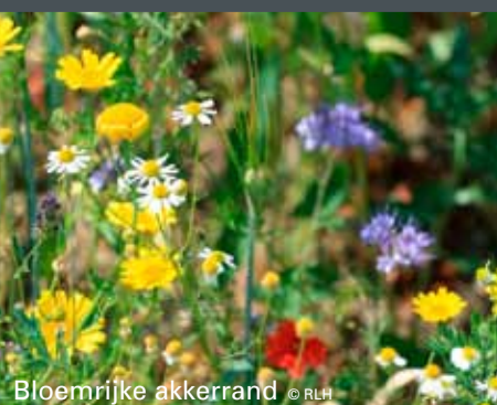
Bloemrijke akkerrand

Nieuw: Landschapsdoe- boek en nieuwe wandelbox