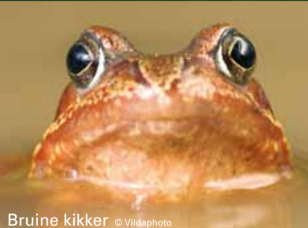
Bruine kikker

BESTE LEZER, je kan dit voorjaar het Verborgen Moois ontdekken in het Speelhof van Sint-Truiden, de Beukenberg, de Jekervallei en de holle wegen in Tongeren. In juni komt het Landschapsdoeboek uit met de bijhorende wandelbox waarmee je de tien Greenspots in Haspengouw kan herontdekken. Kijk ook eens goed rond in je buurt: misschien staat er nog wel een smeedijzeren hek, een oud kapelletje of een veldkruis dat vroeger aan je aandacht ontsnapte. Met het nieuwe project rond Klein Historisch Erfgoed kunnen we deze getuigen uit het verleden volop in de kijker zetten!