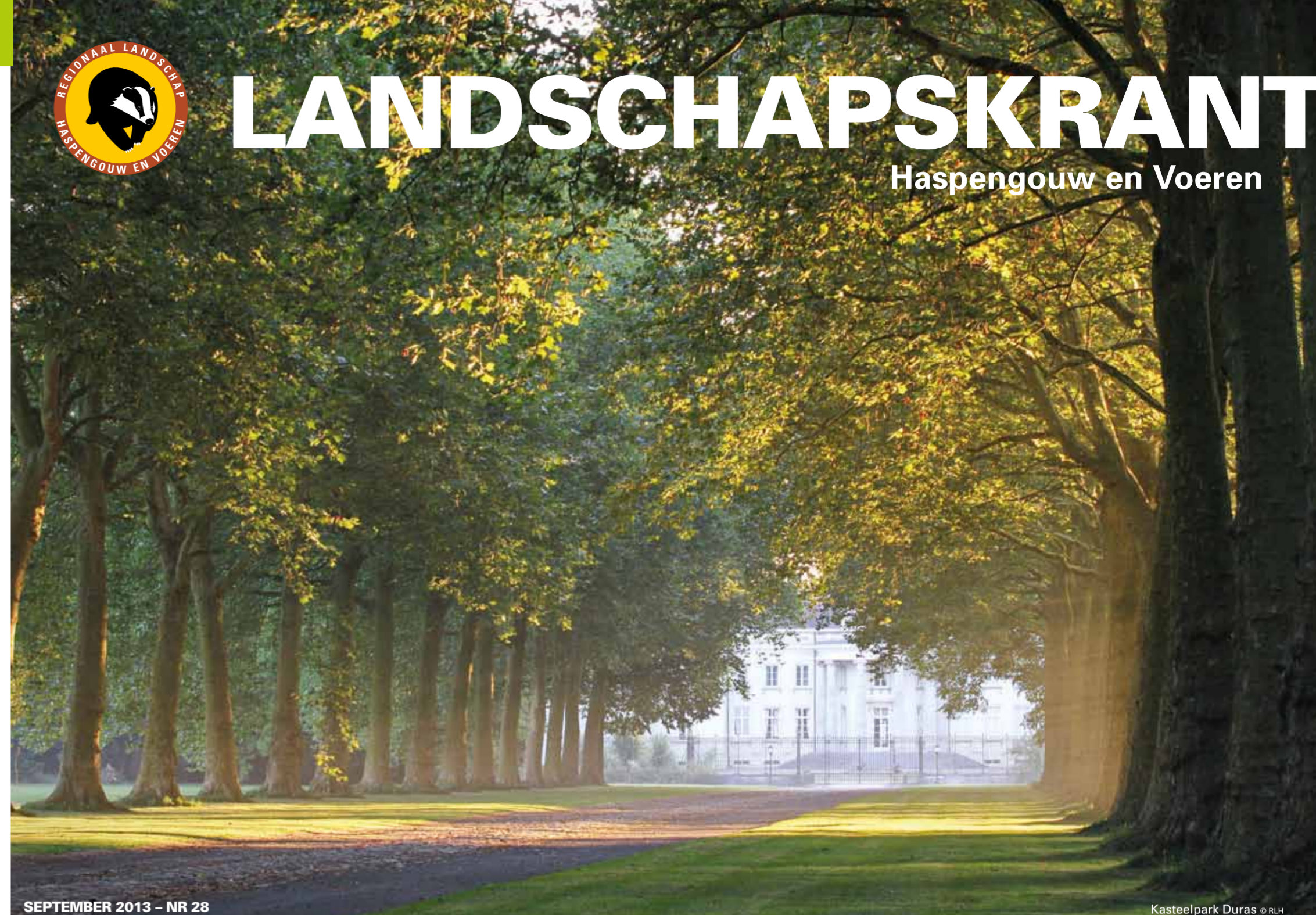
SEPTEMBER 2013 - NR 28