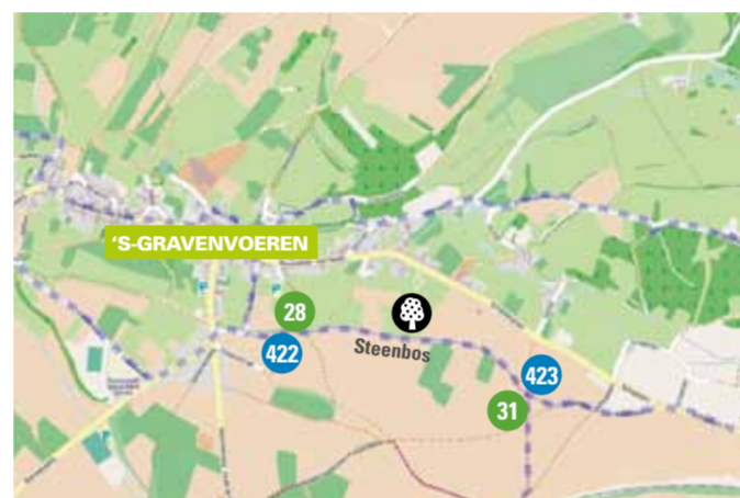
Speelboomgaard 's Gravenvoeren (Voeren) N 50° 45' 18.50" / O 5° 46' 17.48" Gelegen op het wandelknooppuntennetwerk tussen knooppunt 28 en 31, tussen fietsknooppunten 422 en 423.