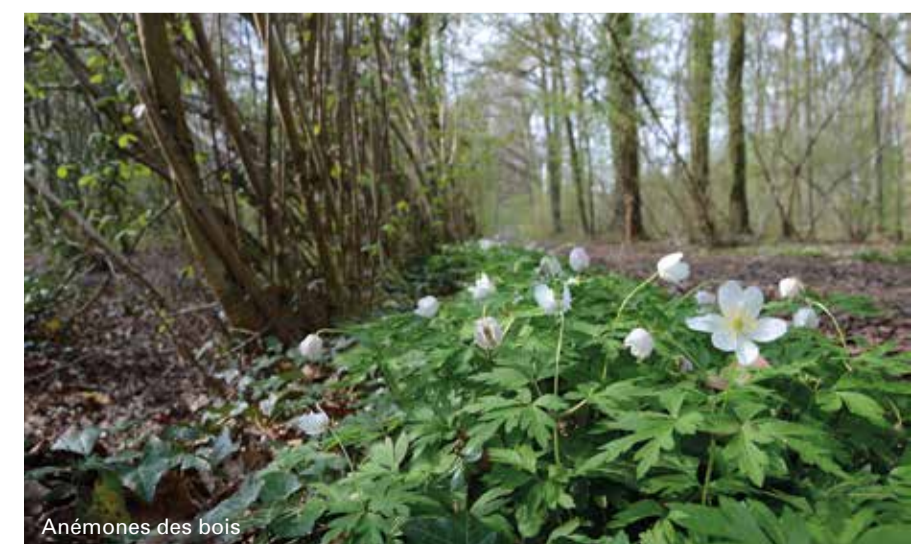
Anémones des bois

Dans cette Beauté cachée, deux nouvelles promenades balisées ont été aménagées. La plus grande partie des promenades sillonne le domaine de l'Agence Nature et Forêt, mais la promenade passe également par quelques domaines privés, le long des parcelles agricoles et de domaines de chasse.