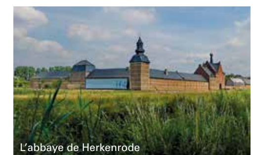
L'abbaye de Herkenrode

Dans ce morceau de paysage unique, le promeneur trouvera très certainement le calme que les abbesses devaient également avoir ressenti à l'époque.