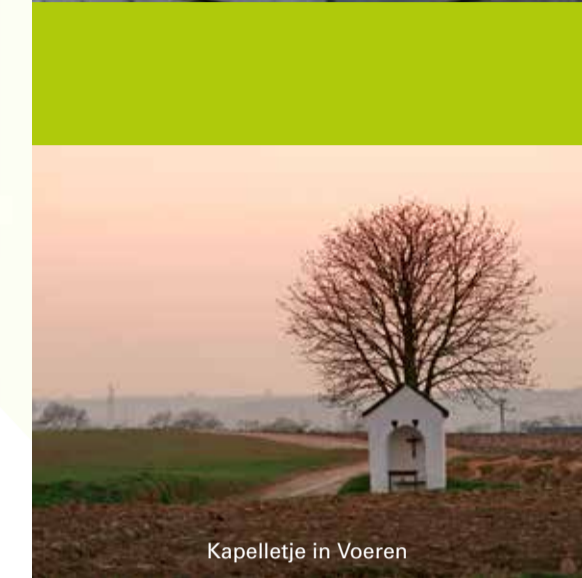
Kapelletje in Voeren