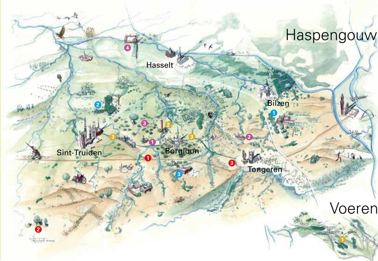
Oud fruitspoor, Zammelen