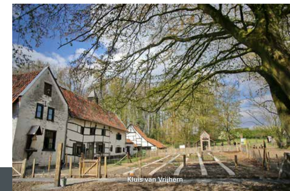
Kluis van Vrijhern