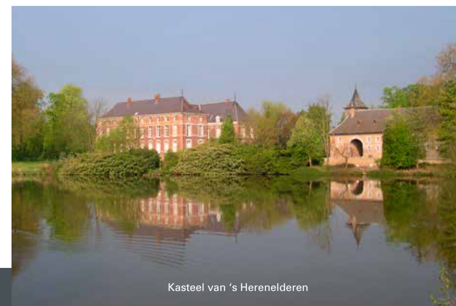
Kasteel van 's Herenelderren