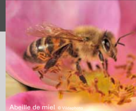
Abeille de miel en vol

Toute personne témoignant d'un sain intérêt pour la nature et pour la gestion de celle-ci est la bienvenue. En quelques vendredis soirs, vous apprendrez à connaître et à comprendre les paysages, les principes écologiques et les processus de gestion. Au cours de visites dans quelques réserves hesbignonnes, vous découvrirez comment se déroule en pratique la gestion de la nature. La série de cours débutera le vendredi 4 octobre 2013 à 19.30h à la "NATUUR.HUIS" de Gelinden: Kleinveldstraat 54, à 3800 Saint-Trond. Plus d'info et inscription: Natuurpunt Limburg, (011 24 60 20) ou jos@natuurpuntlimburg.be .