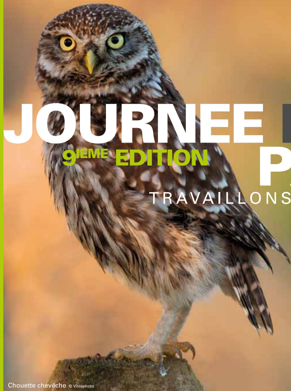
Chouette chevêche